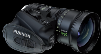
PL-Mount-Zoomobjektiv von Fujinon