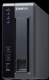
Network Attached Storage Systeme von QNAP